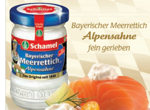
Bayerischer Meerrettich Alpenahne fein gerieben