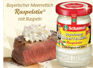
Bayerischer Meerrettich Raspelstix® mit Raspeln