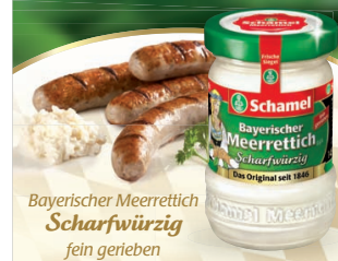
Bayerischer Meerrettich Scharfwürzig fein gerieben

Seit mehr als 150 Jahren garantiert Familie Schamel feinsten reibfrischen Meerrettichgenuss aus Bayern.